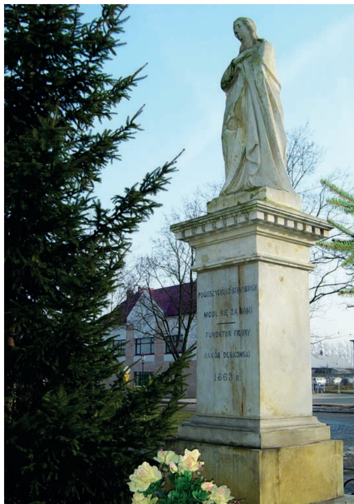
Figura Matki Boskiej w Nieporęcie ufundowana przez Jakóba Dębrowskiego.

Na Placu Wolności położonym w centrum Nieporętu przed kościołem parafialnym, pomiędzy