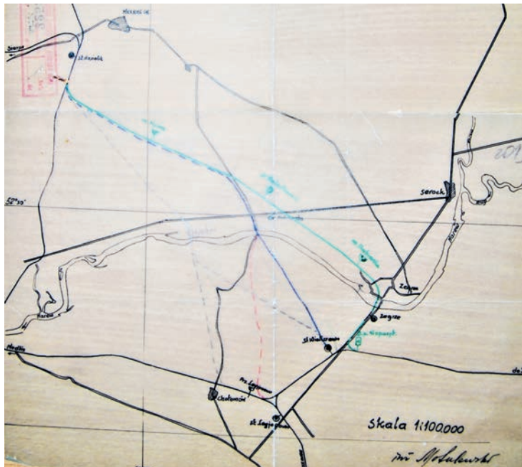
Cztery alternatywne projekty linii kolejowej z początkową stacją: Chotomów (linia czarna przerywana), Legionowo (czerwona przerywana), Wieliszew (niebieska), Nieporęt przez Zegrze (zielona), grudzień 1937 r..

1 lutego 1938 r. Sejm Rzeczypospolitej uchwalił ustawę o budowie normalnotorowej kolei Wieliszew - Nasielsk (opublikowana w Dz.U. nr 8 poz. 47 z 9 lutego 1938 r.), na podstawie której upoważnił rząd do budowy normalnotorowej linii kolejowej użytku publicznego Wieliszew - Nasielsk o charakterze kolei drugorzędnej ogólnej długości około 25 km. Wcześniej projekt ustawy został przyjęty 9 listopada 1937 r., na posiedzeniu Rady Ministrów pod przewodnictwem premiera gen. Felicjana Sławoja Składkowskiego. Natomiast w Sejmie, pierwsze czytanie projektu ustawy odbyło się w środę 1 grudnia 1937 r. i ostatecznie projekt został przyjęty na wtorkowym posiedzeniu 22 grudnia 1937 r. Projekt referował poseł Antoni Hanebach, przewodniczący klubu Parlamentarnej