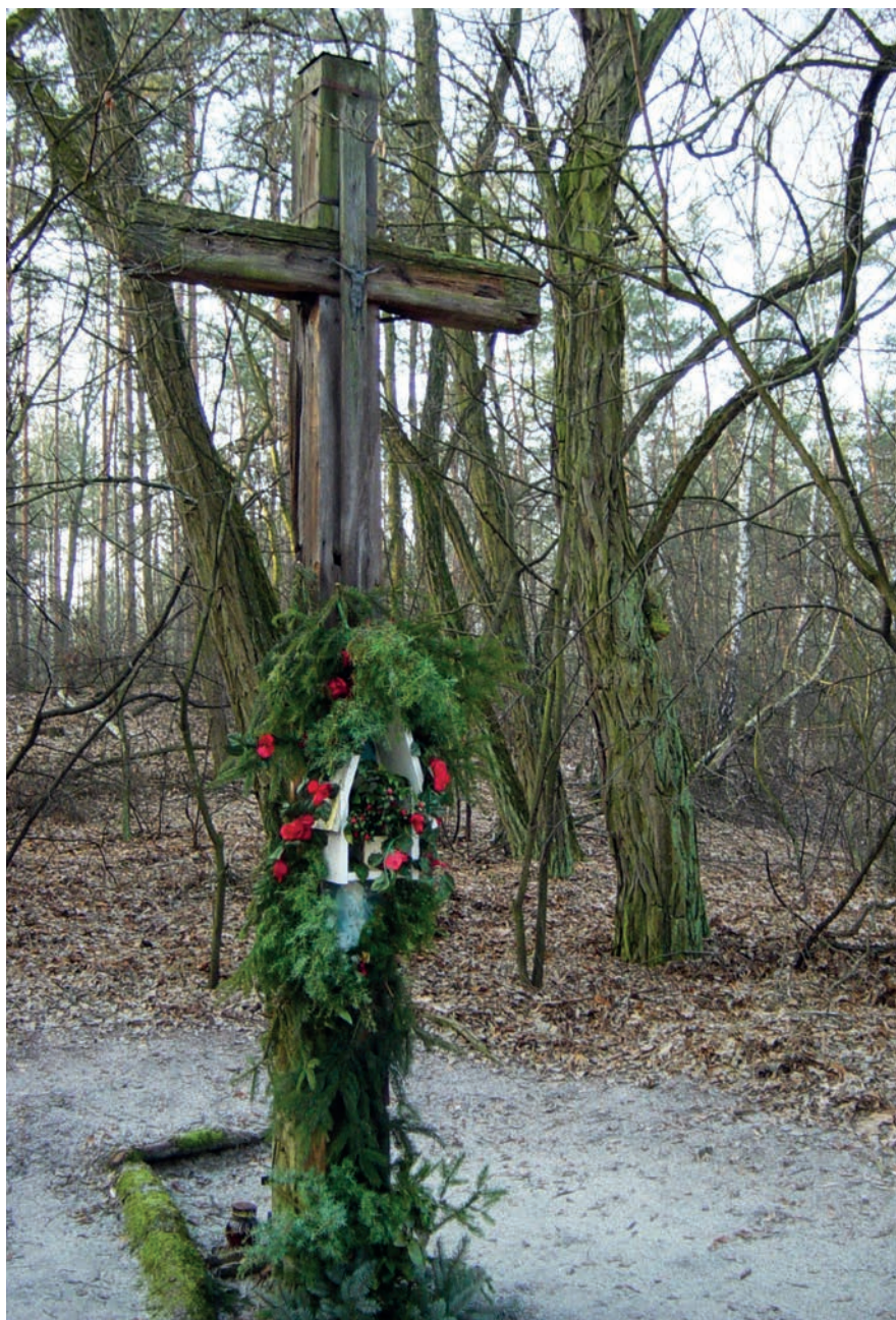
Krzyż powstańczy w Józefowie przy ul. Leśnej stan przed renowacją.

Pamięć i doświadczenia walk powstańczych były podstawą tworzenia Polskiej Organizacji Wojskowej w 1914 r. przez Józefa Piłsudskiego. O samym powstaniu Józef Piłsudski pisał: Pod wpływem wypadków roku 1863 rodzi się inna Polska, z innym ujęciem życia i jego zadań. Skutki sięgają tak daleko, że śmiało rzec można, że dziś jeszcze, gdy dziecko na świat przychodzi, jest obciążone rokiem 1863.