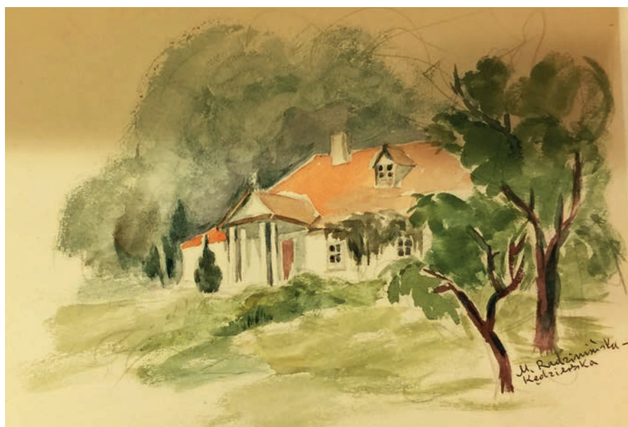
Dworek na akwareli Marii Radziwińskiej-Kędziarskiej (zbiory MBP w Zduńskiej Woli).

17 stycznia 1946 r. - uroczyste przekazanie z koszar w Legionowie do Muzeum Wojska Polskiego czolgu 1. Brygady Pancerniej im. Bohaterów Westerplatte o numerze taktycznym 114. Przy odbiorze obecni byli prezydent Bolesław Bierut i marsz. Michał Rola-Żymierski.