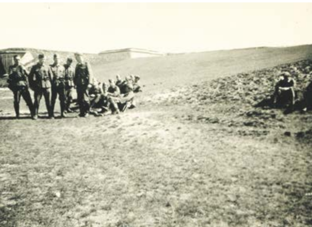
Ćwiczenia żołnierzy łączności na dziedzińcu fortu, Beniaminów 1941 r.