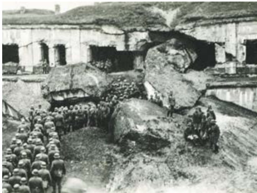
Koszary forteczne w Beniaminowie, okres okupacji (zbiory J. E. Szczepańskiego) Kolumna żołnierzy niemieckich w forcie Beniaminów (zbiory J. E. Szczepańskiego)