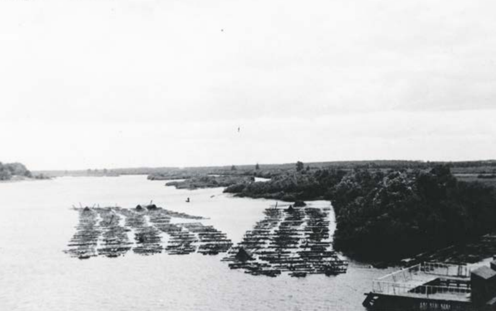
Tratwy przy moście w Zegrzu lata 30 XX wieku

kontakty z ludnością były dobre i zapraszano ich do biesiady, bo doskonale śpiewali oraz grali na skrzypcach i fujarkach.