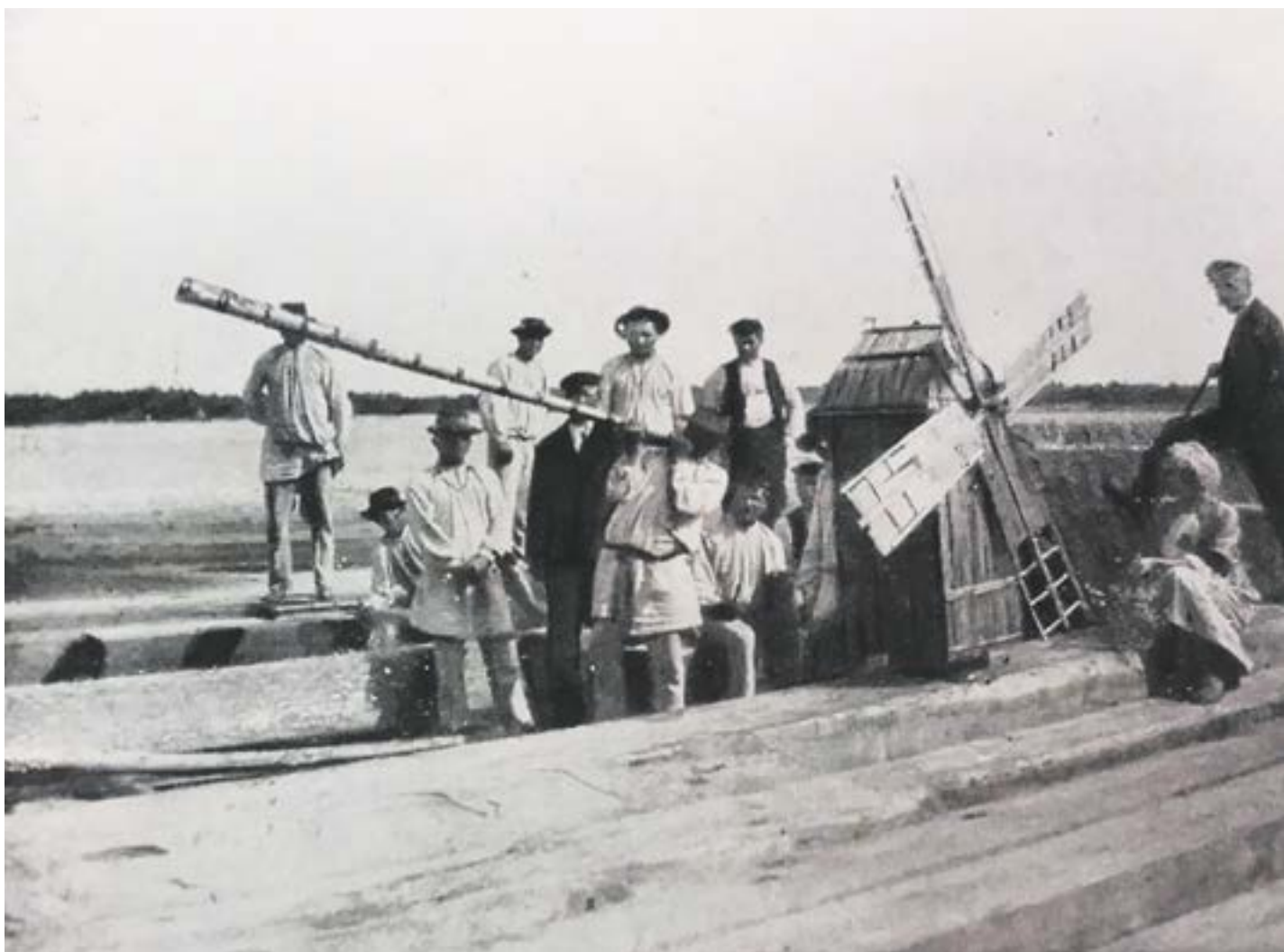
Tratwa flisacka pod Pułtuskim (J. Gajek, K. Zawistowicz-Adamska, „Prace i materiały etnograficzne”, t. VIII-IX, Warszawa 1959)

rana. Działo się to zimą, gdy nie mieli pracy, ale flisacy zwykli byli odwiedzać karczmy także na postojach w czasie splawu, i często wszczynali awantury. Dlatego mieszkańcy nadnarwiańskich i nadbużańskich miejscowości nie lubili flisaków, bo byli oni zawsze skłonni do bitki i wypitki. Zdarzało się, że z brzegów, czyli z bezpiecznej odległości, wołano na nich: „magiery” (od rodzaju noszonych czapek) lub „muzgi” (muzga - wodorost rzeczny). Nieraz