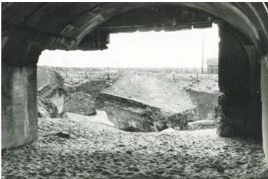
Widok z koszar fortecznych, Beniaminów 1941 r.

Na innej fotografii pochodzącej z 1941 r. zwraca uwagę rozległa perspektywa rozciągająca się z koszar. W dole leżą bloki wysadzonej kaponiery, a w oddali widać piaszczy-