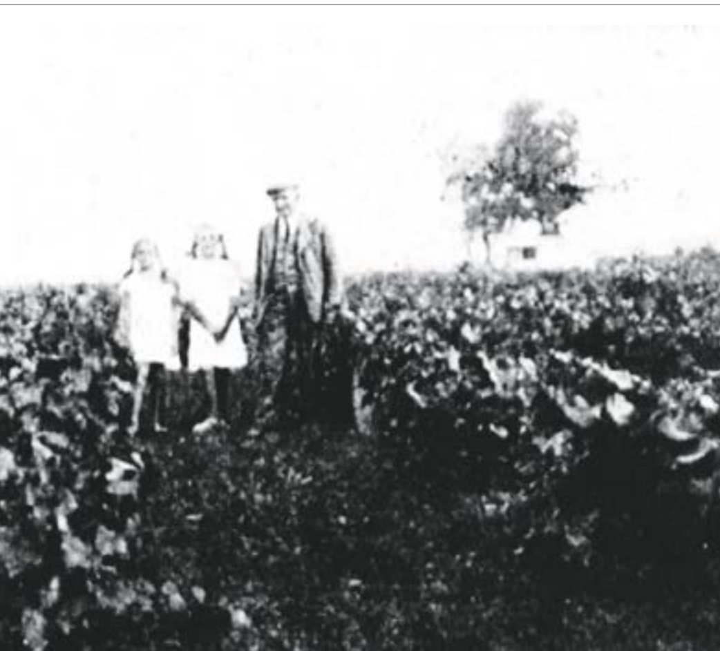
Winnica doktora Bzury w Jabłonninie („Żołnierz Polski”, 1937, nr 37, s. 605).

W ich efekcie otrzymał 12 nowych odmian winorośli – siedem o owocach białych i pięć o czarnych. Jak wynika z ogłoszeń prasowych można je było zamawiać u doktora korespondencyjnie.