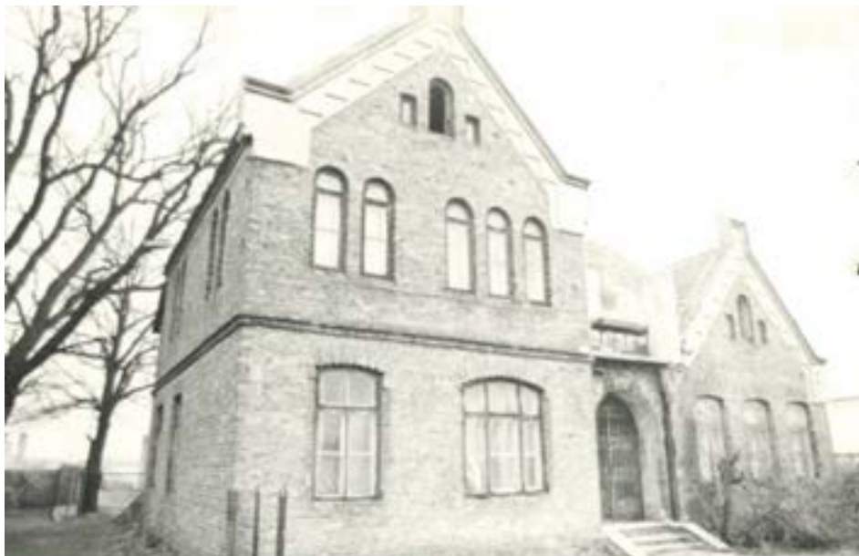
Dom doktora Bzury przy ul. Modlińskiej 78 w Jabłonninie, 1984 r.

blonnie winnicę o charakterze stacji doświadczalnej. Wykorzystał do tego celu grunty o powierzchni 4 morg (ok. 2 ha) przy ul. Szkolnej, które miał otrzymać od Potockich jako ekwiwalent za usługi medyczne dla nich świadczone. Co do dokładnego położenia winnicy toczony są obecnie dyskusje mieszkańców. Bez wątpienia pewną wskazówką co do jej lokalizacji są stare krzewy winorośli, które do dzisiaj można spotkać na działkach w okolicach ul. Szkolnej.