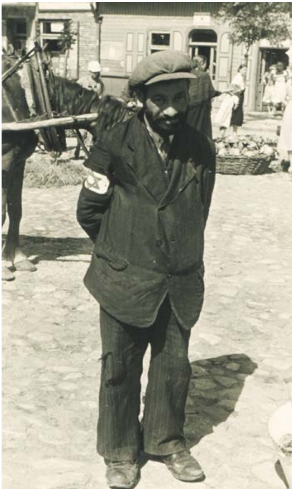
Żydowski sprzedawca na tle budynku przy ul. Rynek 4, Legionowo 11 lipca 1940 r.

Zdjęcie wykonano cztery miesiące przed utworzeniem przez Niemców getta w Legionowie, tzw. Dzielnicy Żydowskiej – 15 listopada 1940 r. Do tego czasu ludność żydowska mieszkała, tak jak przed woj-