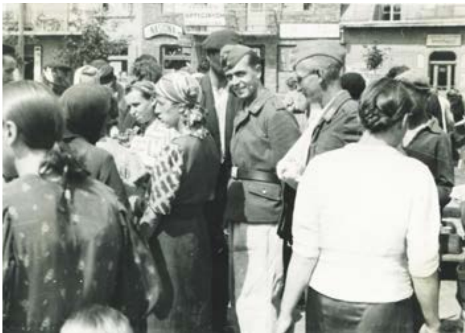
Targ na legionowskim rynku, okres okupacji niemieckiej. W głębi budynek przy ul. Rynek 4

Drewniany budynek przy ul. Rynek 4 zapamiętało wielu mieszkańców Legionowa, gdyż istniał on do lat 90. XX w. W latach 1965–1978 mieścił Miejską Bibliotekę Publiczną. Po rozbiórce drewniaka, w 1994 r. oddano tu do użytku nową siedzibę Banku Spółdzielczego.