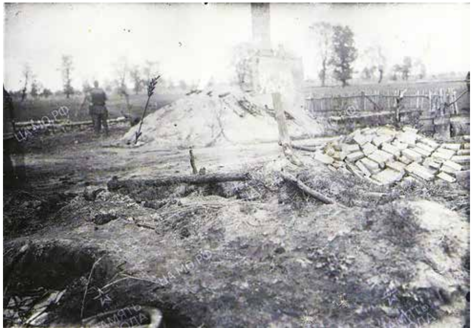
Dom przy ul. Dworcowej zniszczony ostrzałem artyleryjskim, 1944 r.

Wróciliśmy do pieleszy parafialnych w skąpej gromadce 19 stycznia 1945 r. Dni były mroźne o silnych wschodnich wiatrach. W Nieporęciu rządziły rosyjskie władze wojskowe. Była garść ludności. Uniknęli ewakuacji będąc na Pradze, lub przedarli się w kierunku Pragi podczas ewakuacji oszukawszy straż niemiecką. Kościół zobaczyliśmy bez dachu, drzwi i okien. Wewnątrz brud i dwa paleniska, na których spłonęły: ambona, ołtarze, balustrada, chór, ławki, obrazy, schody prowadzące do stropu. Ocalał daszek ambony, część górna ołtarzy i obraz Pana Jezusa mocno zniszczony. Żołnierze rosyjscy opowiadali, że w kościele byli więzieni jeńcy niemieccy. Pora zimowa skłoniła ich do ogrzewania wnętrza świątyni, przemienionego na więzienie. Południowa ściana kościoła, w górnej warstwie, rozbita wraz z oknem. W dolnej warstwie wyrwa, zakryta kaptuńska ma duży otwór, na sklepieniu leżał niewypał, który ocalił sklepie-