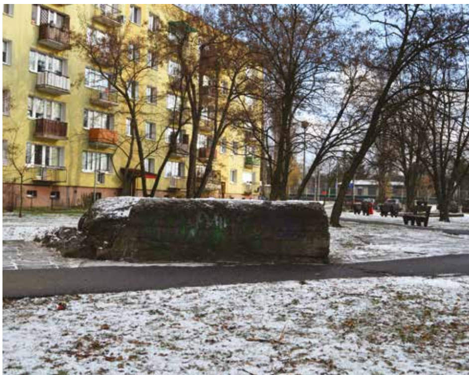
Współczesne pozostałości po betonowym przyczółku kolejowym na osiedlu Piaski (fot. B. Gralicki, 29 listopada 2023 r.)

31 grudnia 2010 r. - zlikwidowano Szkołę Podoficerską Wojsk Lądowych w Zegrzu, utworzona w 2004 r.