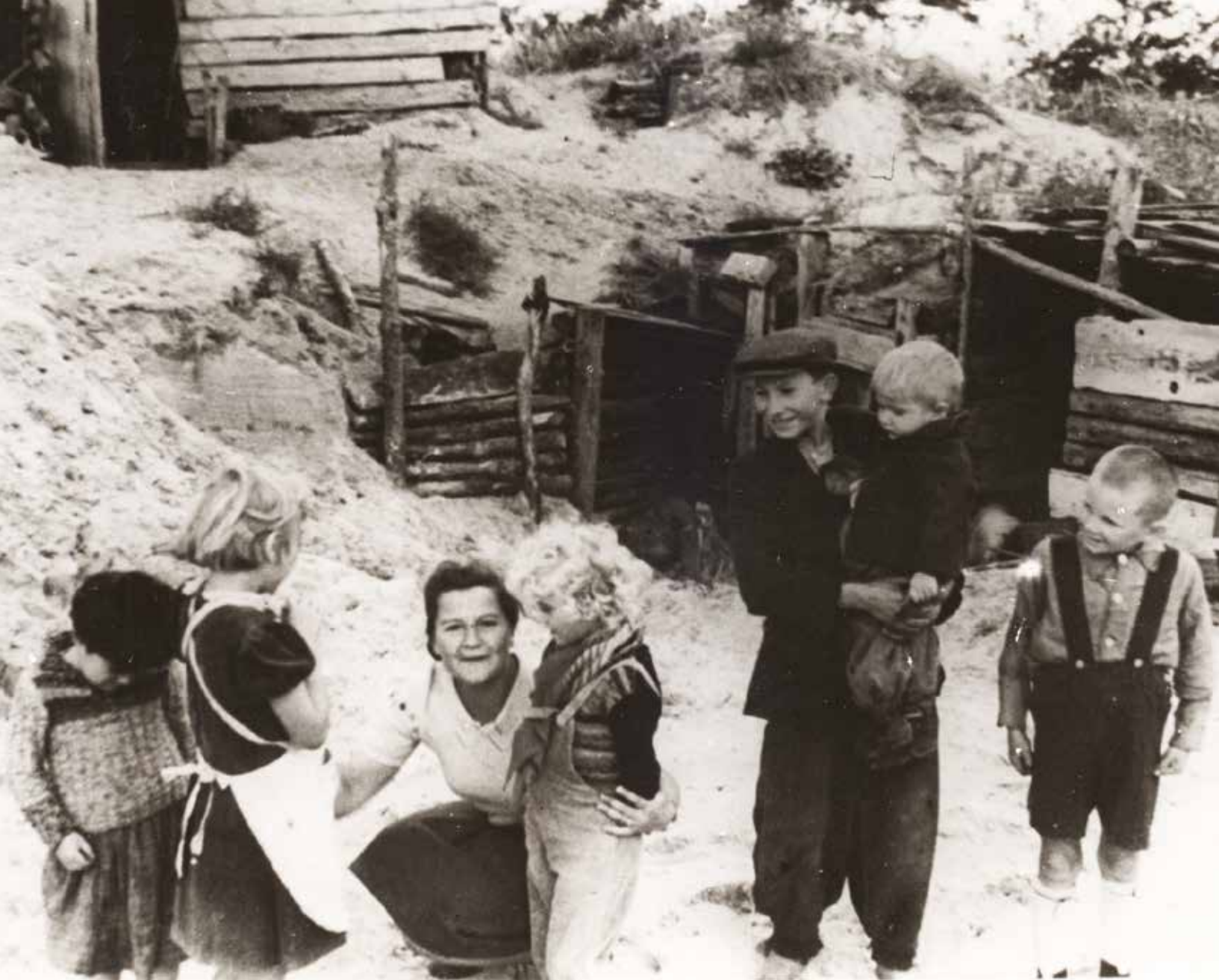
Ziemianki w jakich mieszkaly całe rodziny, 1946 r.

Wojny praktycznie nie przetrwały też zwierzęta gospodarskie. Z 3000 krów przed wysiedleniem, gospodarzom pozostało 19 sztuk, a z 1200 koni pozostało 25. Na początku 1946 r. udało się zwiększyć liczbę zwierząt do 300 koni i 200 krów.