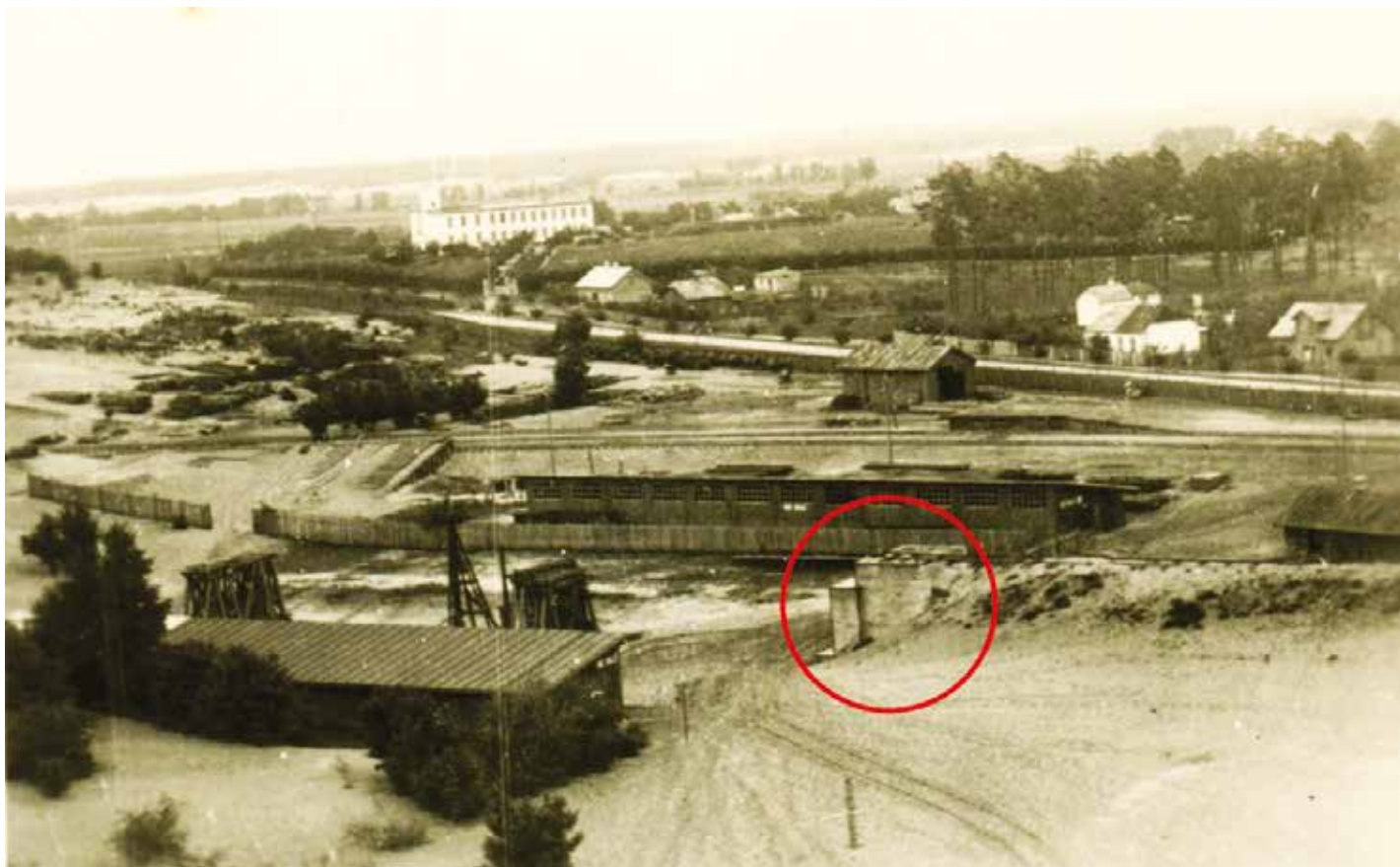
Panorama Bukowca C z zaznaczonym przyczółkiem mostu kolejowego, 21 IX 1939 r.

We wrześniu 1939 r. niemieccy żołnierze często fotografowali zajęte Legionowo. Zdjęcia okupanta mają dużą wartość poznawczą. Na odwrocie prezentowanej fotografii widnieje data 21.9.39. Została ona wykonana prawdopodobnie z hangaru 2. Batalionu Balonowego (dziś teren osiedla Piaski) w kierunku Państwowego Instytutu Meteorologicznego i osiedla Bukowiec C.