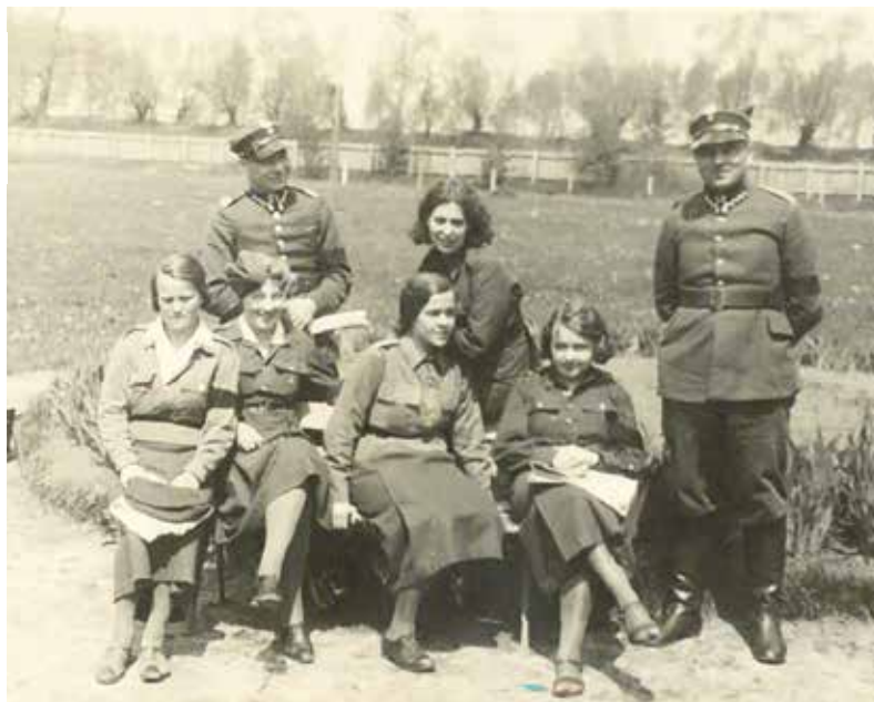
Juzistki w towarzystwie podoficerów

Juzistki były zakwaterowane w budynku przy ulicy Odzieczi Lwowa (obecnie Groszkowskiego) znajdującym się z dala od koszar podchorążych i w pobliżu kościoła, co stanowiło to miejsce bezpiecznym. Podchorążowie znaleźli jednak sposób na poznanie uroków dziewcząt. Wieczorami udawali się pod budynek łaźni znajdujący się przy ulicy Kaniowskiej (dzisiejszej Radziwiłłowskiej) i przez wylamany róg szybki w zamalowanym oknie podglądali kąpiące się dziewczęta. Miarka się przebrała i kurs telegrafistek-juzistek rozwiązano. Podobno