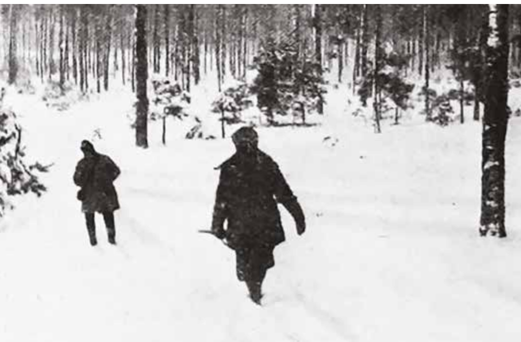
Rozprowadzanie myśliwych podczas polowania wigilijnego w Jabłonnie, 24 grudnia 1935 r.

Na polowaniach zjawiali się również dalsi krewni i przyjaciele z Galicji i Poznańskiego oraz wysocy