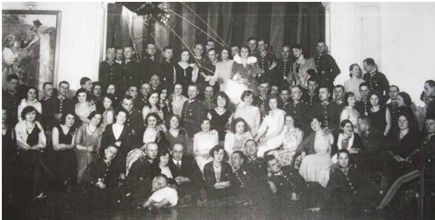
Bal w kasynie w Zegrzu z udziałem podchorążych i jużistek

Dzisiaj zaprezentuję Państwu anegdoty z okresu II Rzeczypospolitej.