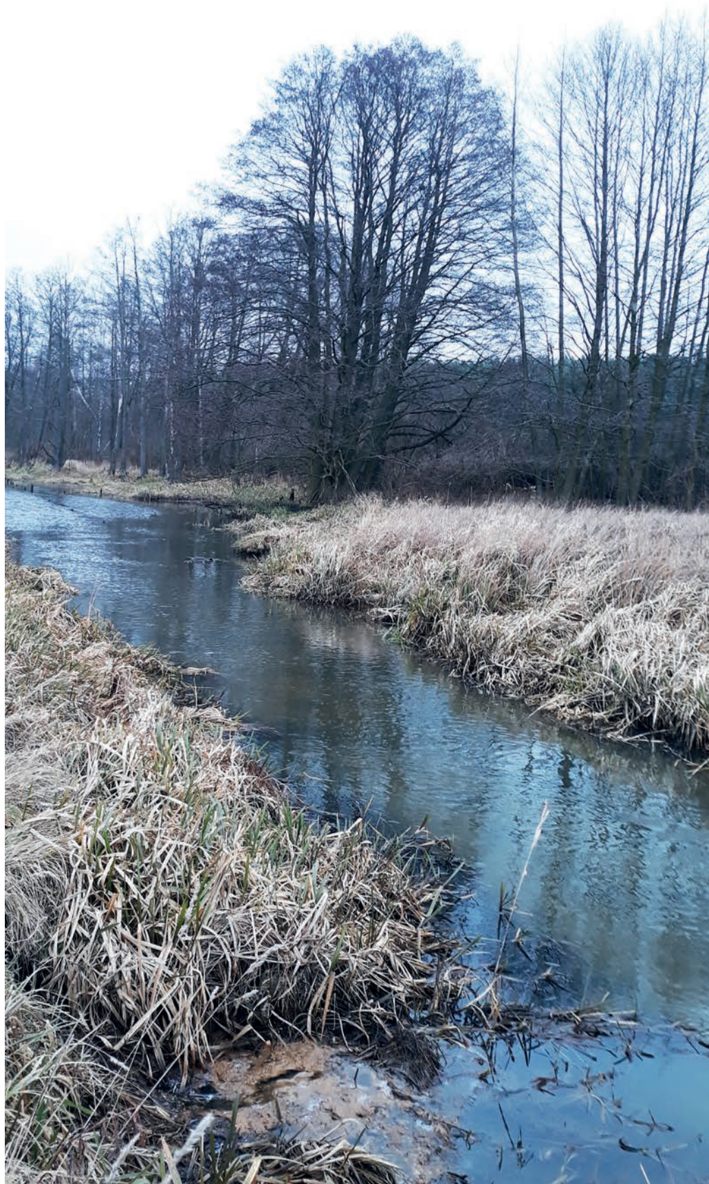
Podmokle okolice wczesnośredniowiecznej osady