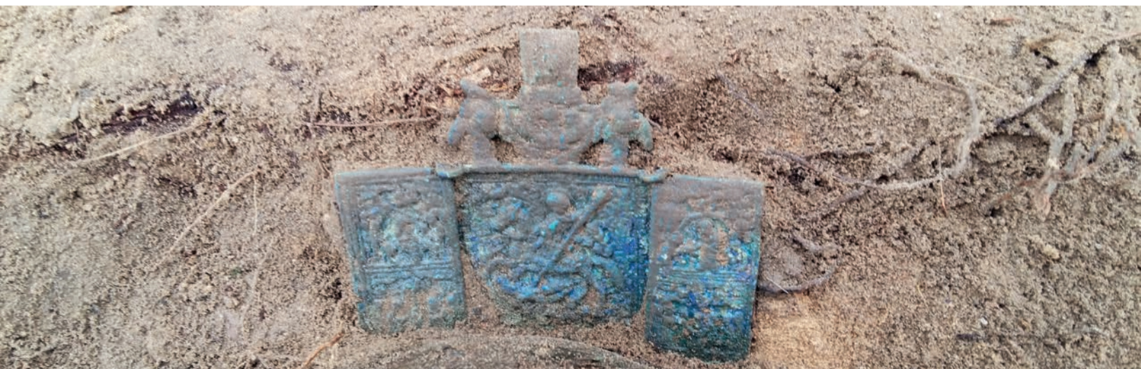
„Ołtarzyk podróżny” złożony przy głowie zmarłego

Nowe światło na historię tej miejscowości rzuciły badania archeologiczne, którymi w 2017r. miałem przyjemność kierować. Prowadzone były na terenie dawnego cmentarza parafialnego. Zadokumentowano wówczas 170 pochówków. Część z nich zorientowana była na osi północ – południe a część na osi wschód – zachód. Wszystkie szczątki zostały przebadane przez antropologa, a wyniki tych analiz są bardzo interesujące. Okazało się, że realna liczba osób sięga 280. Ale jeśli wzięlibyśmy pod uwagę wszystkie,