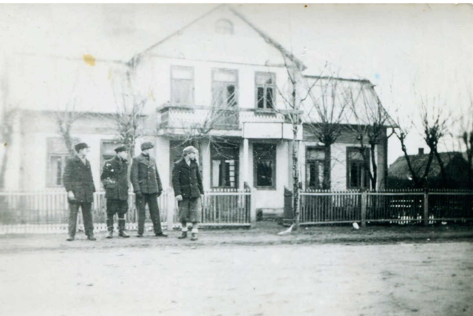
Patrol Szarych Szeregów przed „Café San Remo”, marzec 1944 r.

lu. Starsi mieszkańcy Legionowa wspominali, że nad restauracją „San Remo” działał półoficjalny Puff.