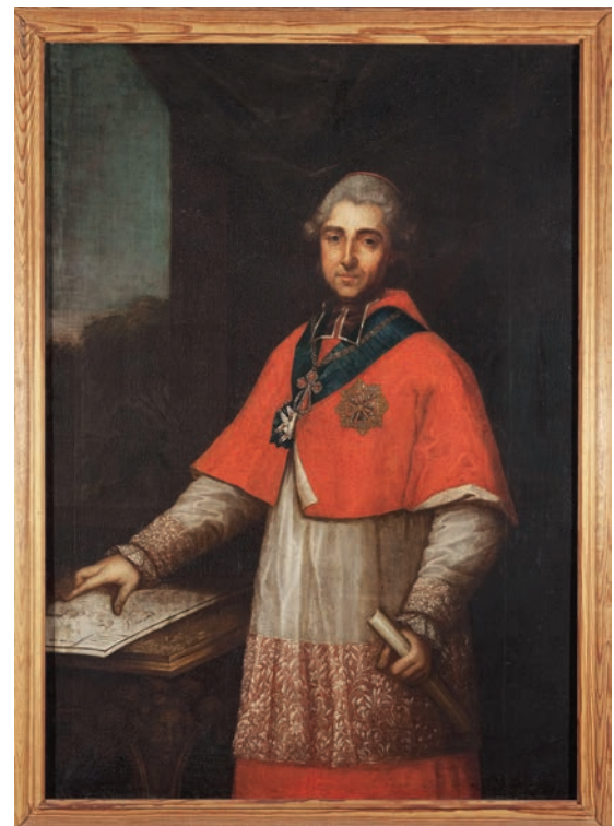
Portret prymasa Michała Poniatowskiego (Muzeum Narodowe w Warszawie)

skiej leżącego, do Biskupstwa Plockiego należącego, za inne dobra przez Przewielebnego Xcia Michała Poniatowskiego Biskupa Plockiego kupić miane, w porządku zayść maiącey takowey zamiany, iuż przez Delegowanych z pomiędzy siebie prowent z rzeczonych dóbr Jabłonnny cum attinentiis (łac.