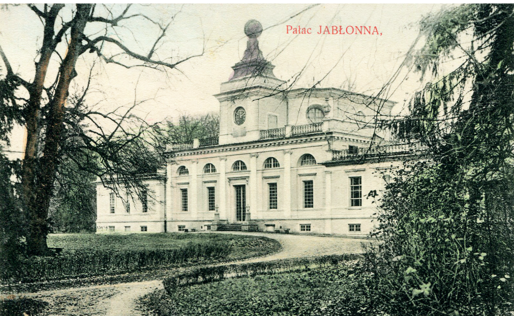
Pałac w Jabłonie na początku XX w.