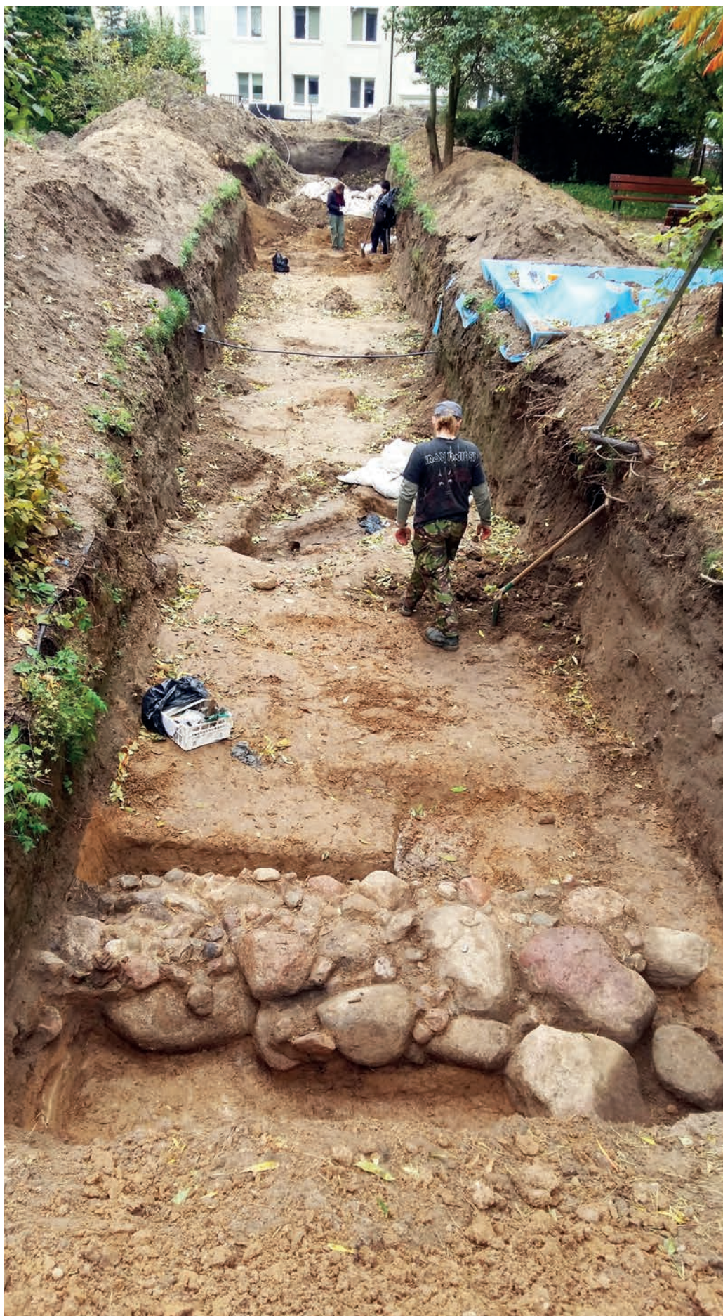
Badania archeologiczne w Zegrzu