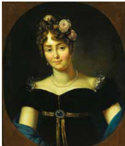
Portret Marii Walewskiej pędzla François-Pascala-Simon Gérarda, po 1810 r. (kopia w zbiorach Muzeum Narodowego w Warszawie)

Wydarzenia te miały też pewne konsekwencje dla Anetki, której osobą zainteresował się Murat, wówczas wielki książę Bergu. Przekazał on Potockiej klucz do swego apartamentu z niedwuznacznym zaproszeniem „na herbatę”. Rozwścieczona propozycją hrabina oświadczyła, że odda klucz swojej teściowej, która jako osoba starsza nie lubi tłumnych