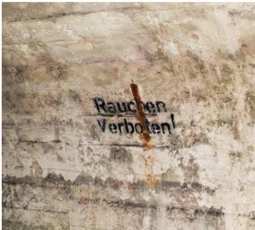
Jeden z zachowanych napisów w schronie – element scenografii filmu

Główny bohater filmu Franciszek Kalina spotyka na drodze miejscową lekarzkę Justynę. W tym momencie po raz pierwszy widać drogę od nieczynnej strzelnicy do fortu. Justyna wiezie Franciszka w pobliże starej garbarni. Potem oboje idą po brukowanej drodze. To droga na terenie fortu wiodąca na dziedziniec; jej fragment został pokryty kamieniami na potrzeby filmu. Następnie Franciszek wchodzi po schodach do metalowej furtki. Te betonowe schody wiodą do schronu znajdującego się na wale fortu. Metalowa furтка