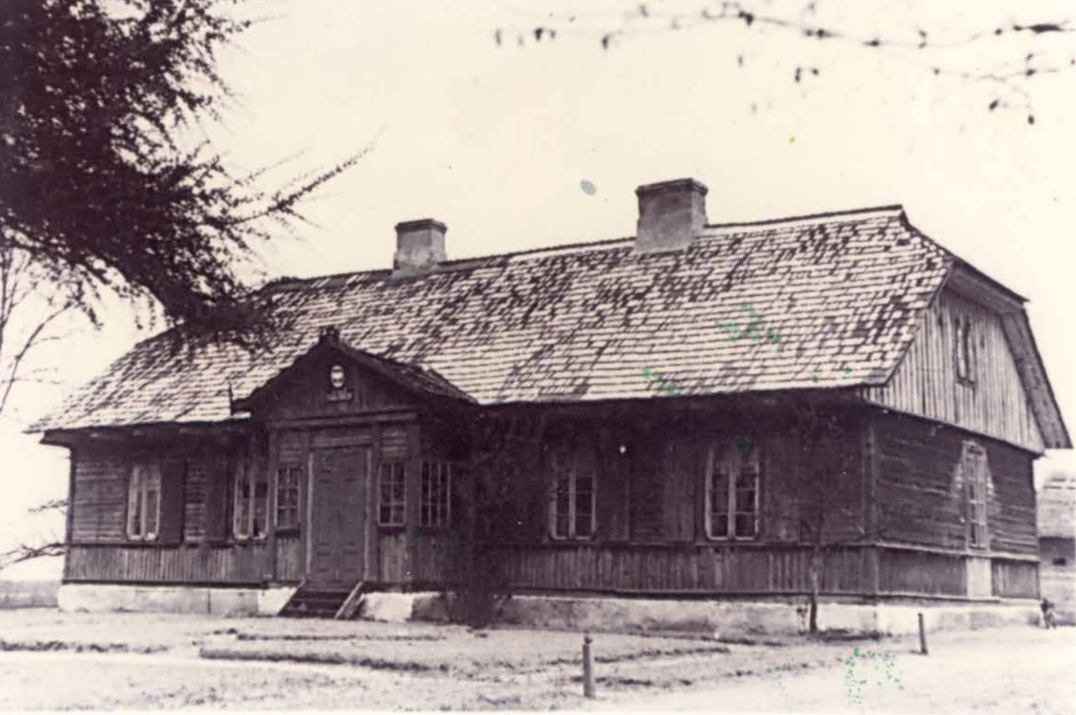
Budynek Szkoły Powszechnej w Nieporęcie, pocz. lat 30. XX w.