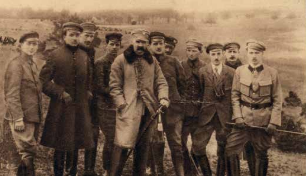
Ćwiczenia Polskiej Organizacji Wojskowej na polach Wawra i Zielonej 29 kwietnia 1917 r., w których uczestniczył brygadier Józef Piłsudski – ówczesny szef Departamentu Wojskowego Tymczasowej Rady Stanu oraz członkowie Komendy Naczelnej POW (karta wydana przez Komitet Budowy Pomnika Poległych Peowiaków)