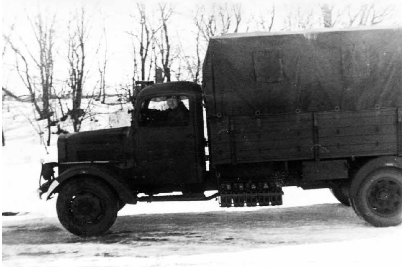
Niemiecka ciężarówka w Legionowie, marzec 1942 r.

Spośród niemieckich instytucji działających w czasie II wojny światowej w Legionowie starsi mieszkańcy często wspominali tzw. Stralo. Nazywali tak bazę remontową ciężarówek Wehrmachtu, która znajdowała się na Bukowcu A od strony Jabłonny.