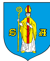
Miasto i Gmina Serock