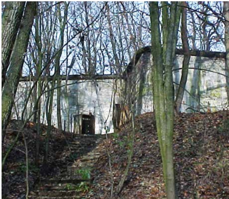
Schron na wale fortu „zagrał” starą garbarnię

Główny „Pokłosie” (premiera w 2012 r.) było nagrywane między innymi w Zegrzu. Około 6 minut filmu powstało na drodze dojazdowej i na terenie mniejszego fortu w Zegrzu. W 2011 r. w miejscowości pojawili się znani twórcy: Władysław Pasikowski (reżyser), Allan Starski (scenograf) i Paweł Edelman (autor zdjęć).