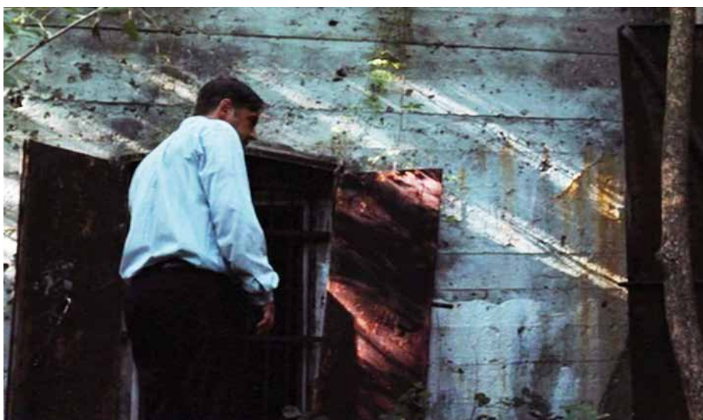
Kadry z filmu: główny bohater przed schronem – garbarnią