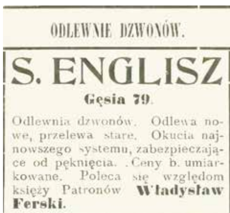
Reklama odlewni dzwonów S. Englisz, Księga Adresowa Królestwa Polskiego na Rok 1910