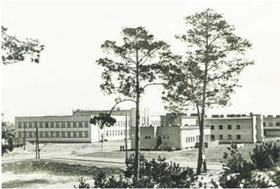
Gmach szkolny i hotel Centrum Wyszkozenia Kolejowego w Legionowie, 1942 r.

W latach 30. Legionowo zaczęło przekształcać się w znaczący węzeł kolejowy. W 1936 r. została wybudowana linia z Legionowa do Tuszczu, w 1937 r. oddano do użytku nowoczesny budynek dworca, a w 1939 r. powstała linia Legionowo–Nasielsk. W sierpniu tego samego roku ukończono w Legionowie budowę Centrum Wyszkozenia Kolejowego – mającego stać się centralnym ośrodkiem kształcenia polskich kadr kolejowych.