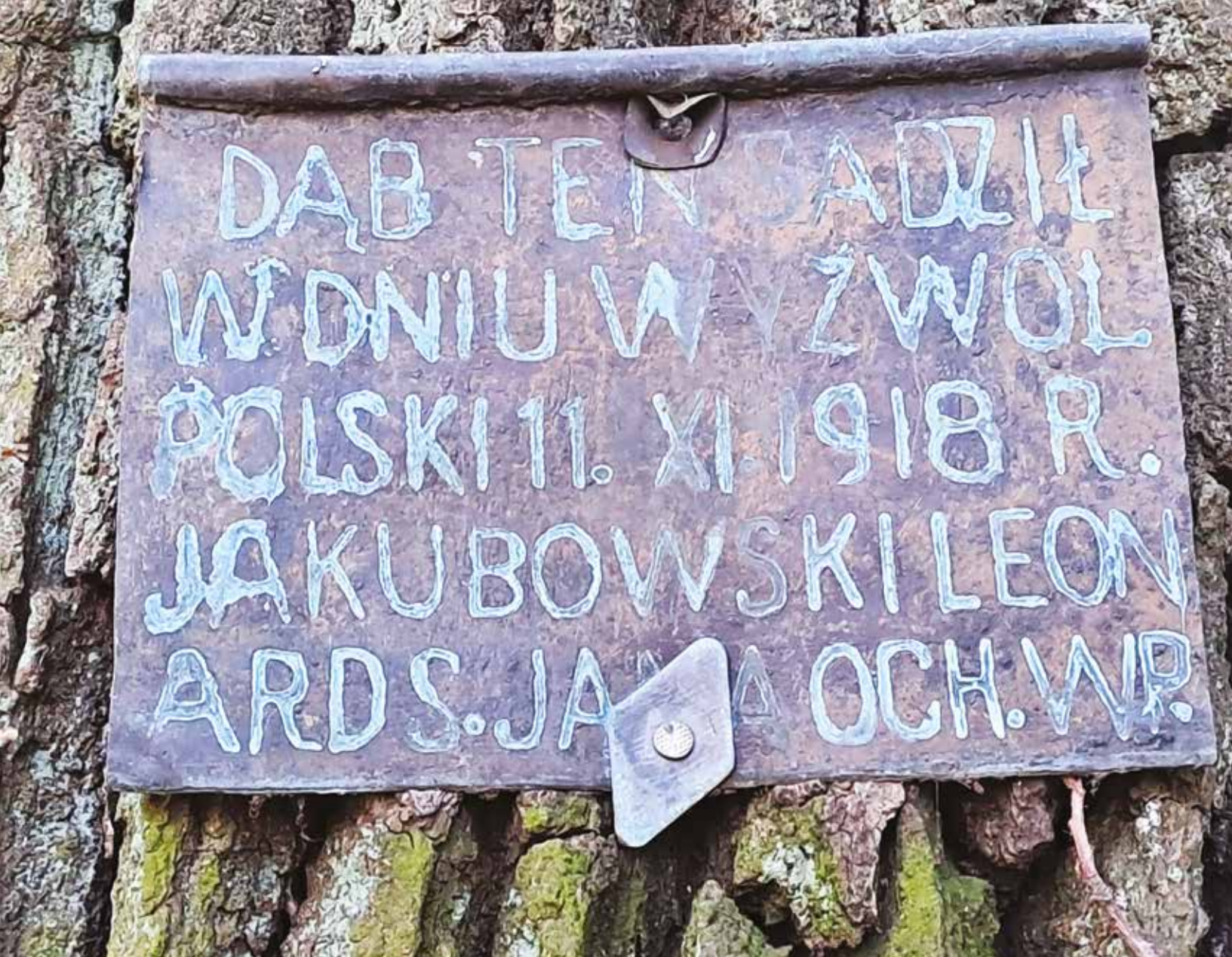
Tabliczka na dębie

Zaraz po umundurowaniu i uzbrojeniu Leonard i jego koledzy zostali wysłani do rozbierania Niemców w Magistracie. Wieczorem oddział trafił do fabryki Gerlacha na Woli, gdzie pełnił warty, a po kilku dniach przeniesiono go do koszar na ulicy Nowowiejskiej.