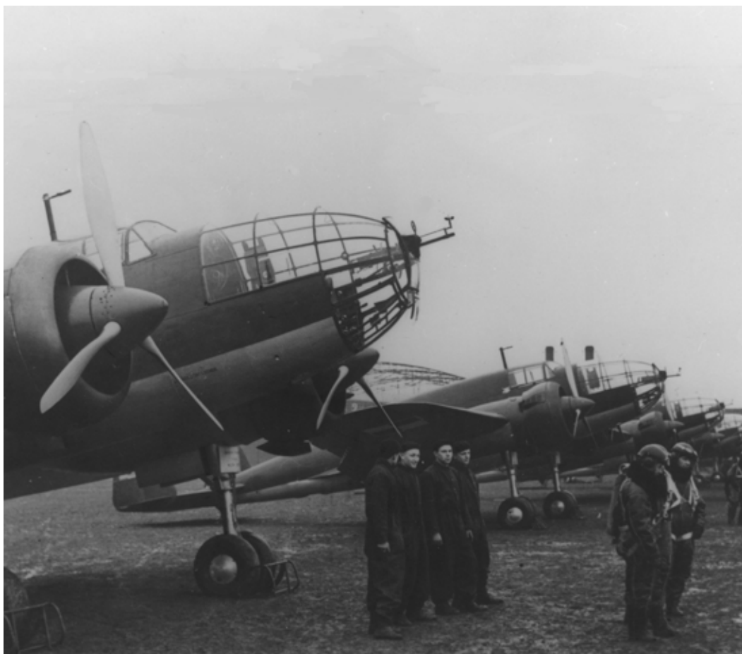
Żałogi przy bombowcach PZL 37 „Łoś”

Tuż przed wybuchem wojny personel pochodził z ostatnich roczników pilotów szkół lotniczych i młodych absolwentów szkół dla podoficerów - w przypadku strzelców pokładowych. Szkolenie dla pilotów i obserwatorów (nawigatorów) „Łosi” było bardzo intensywne i obejmowało zajęcia z nawigacji oraz opanowanie płynności sterowania płatowcem poprzez właściwe wykorzystanie ciągu dwóch silników typu PZL Bristol Pegaz i optymalne sterowanie przepustnicami.