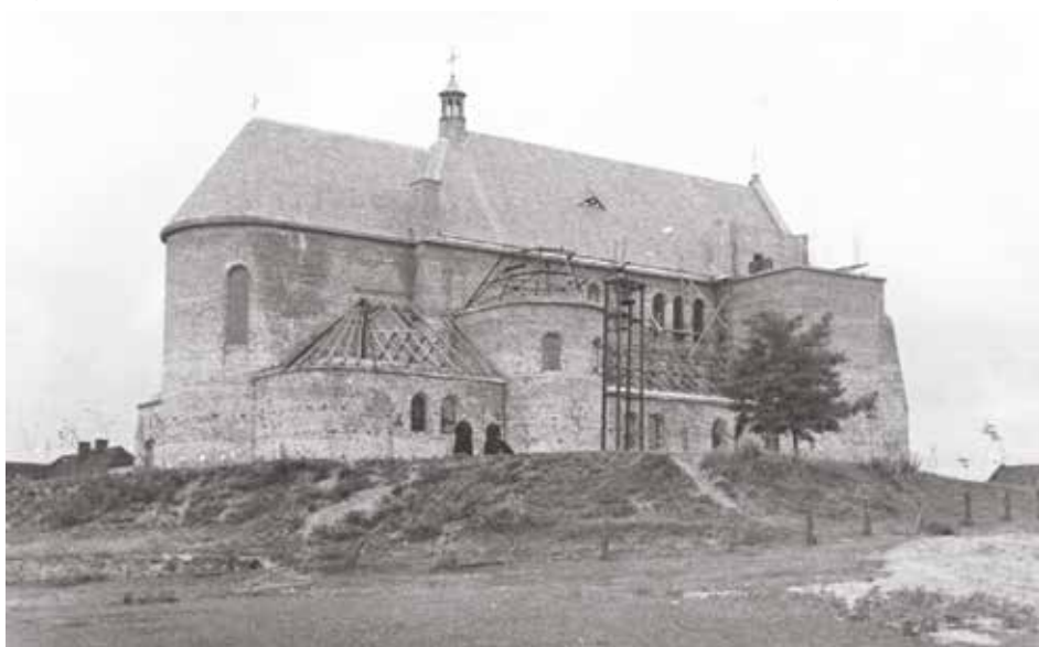
Konstrukcja prowizorycznej dzwonnicy przy budowanym kościele w Wieliszewie

Ponadto informacja zawarta w dokumencie Plan rozwoju miejscowości Wieliszew , będącym załącznikiem nr 1 do uchwały Nr 273/XXV/05 Rady Gminy Wieliszew z dnia 5 kwietnia 2005 r. mówi, że według powtarzanej legendy dzwony zdjęte z kościelnej wieży podczas I wojny światowej w celu przetopienia na „armaty” odnalazły się po wojnie w Austrii i powróciły do Wieliszewa. Potwierdzenie tego ustnego przekazu mieszkańców możemy znaleźć w artykule Eugeniusza Kado pod tytułem Legenda czy historia? zamieszczonym w miesięczniku „Nasza Gmina” nr 2 (35) z lutego 1995 r., w którym przedstawia fakt wywozu dzwonu i jego odnalezienia, aczkolwiek datuje ten w fakt w okre-