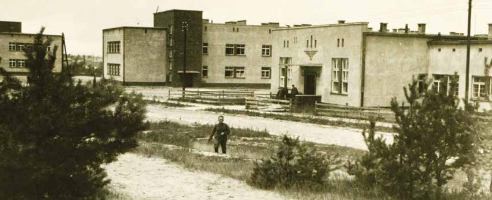
Stołówka i internat Centrum Wyszkozenia Kolejowego w Legionowie, 1940 r.

nych od wojska. Ogółem do końca 1940 r. planowało wystawić 24 kompanie drogowo-kolejowe, 24 kompanie robocze i 24 kompanie ruchowo-kolejowe i 2 plutony kolei wąskotorowych. Miały one wykonywać prace torowe, odbudowę urządzeń stacyjnych i sieci sygnalizacyjnych oraz mostów do 20 m.