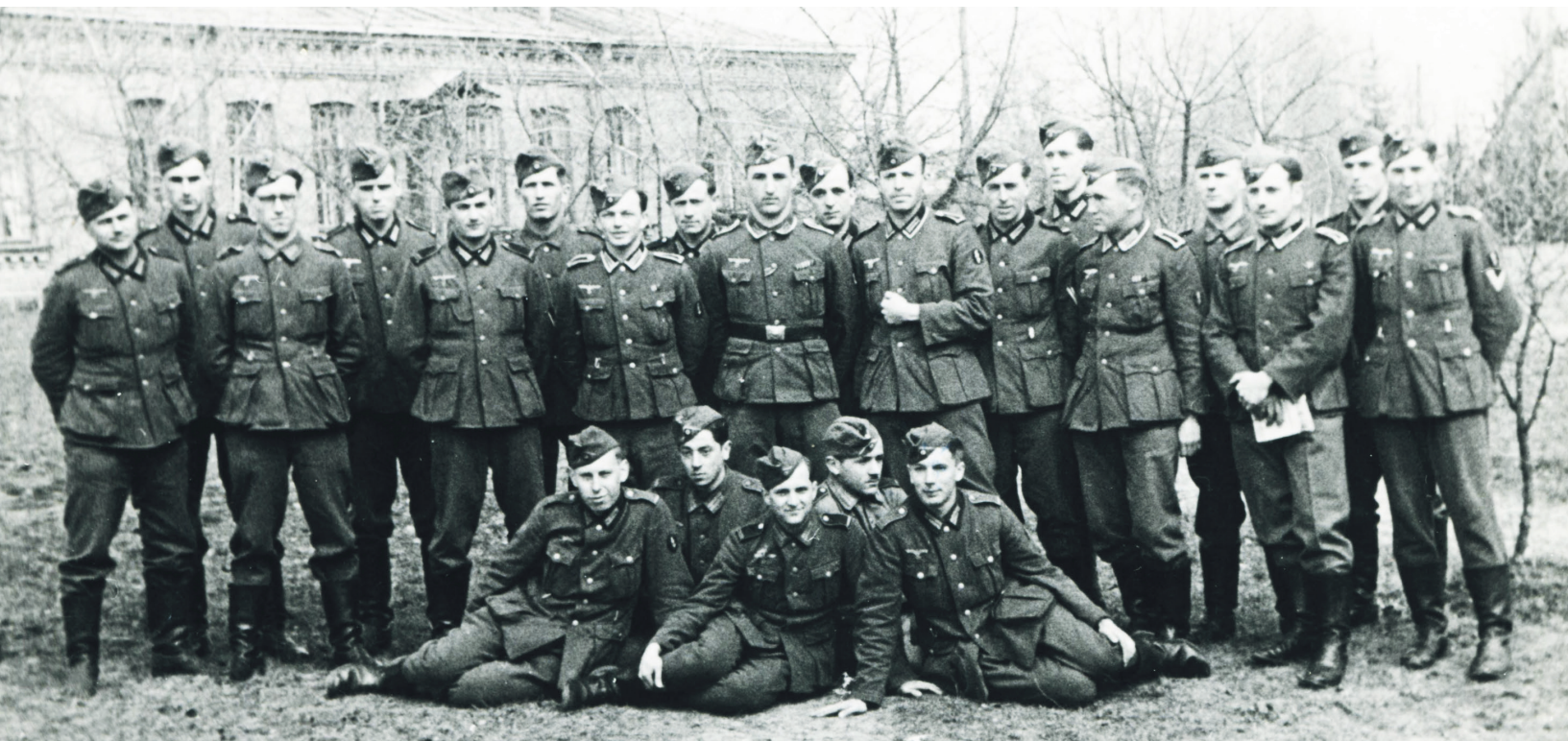
Pododdział łączności w Beniaminowie, 1941 r.