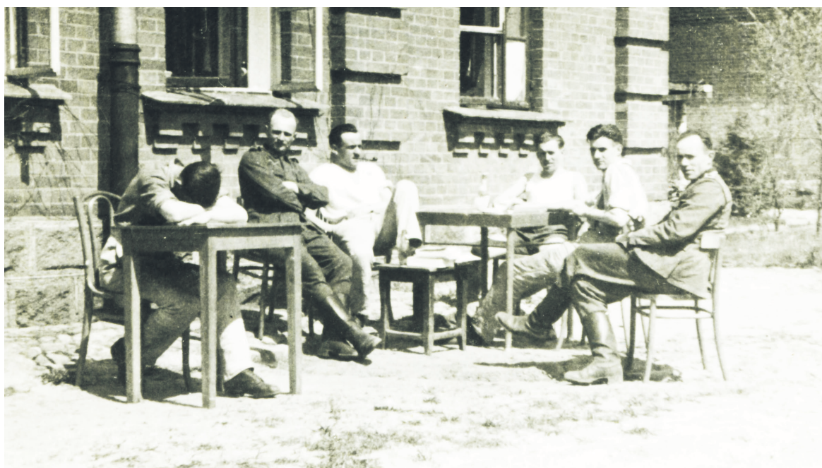
Pododdział łączności w Beniaminowie, 1941 r.

Tyłowy garnizon w Beniaminowie wiosną 1941 r. był miejscem monotonnej służby. Na jednej z fotografii widzimy zmęczonych żołnierzy, siedzących przy stole. Na odwrocie widnieje napis: „Niedzielne popołudnie w Beniaminowie”. Szkolenie wojska prowadzono m.in. w pobliskim forcie Beniami-