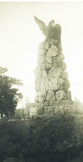
Pomnik internowanych oficerów legionowych, Beniaminów 1941 r.

Przed uderzeniem III Rzeszy na ZSRR w czerwcu 1941 r. na terenach okupowanej Polski dowództwo Wehrmachtu skoncentrowało ogromne siły wojskowe. Niemieccy żołnierze zakwaterowani w przedwojennych polskich garnizonach często fotografowali siebie na tle koszar oraz najbliższe okolice. Dzięki zdjęciom jednego z nich możemy zobaczyć jak wyglądały koszary w Beniaminowie wiosną 1941 r. Wykonano je jeszcze przed napa-