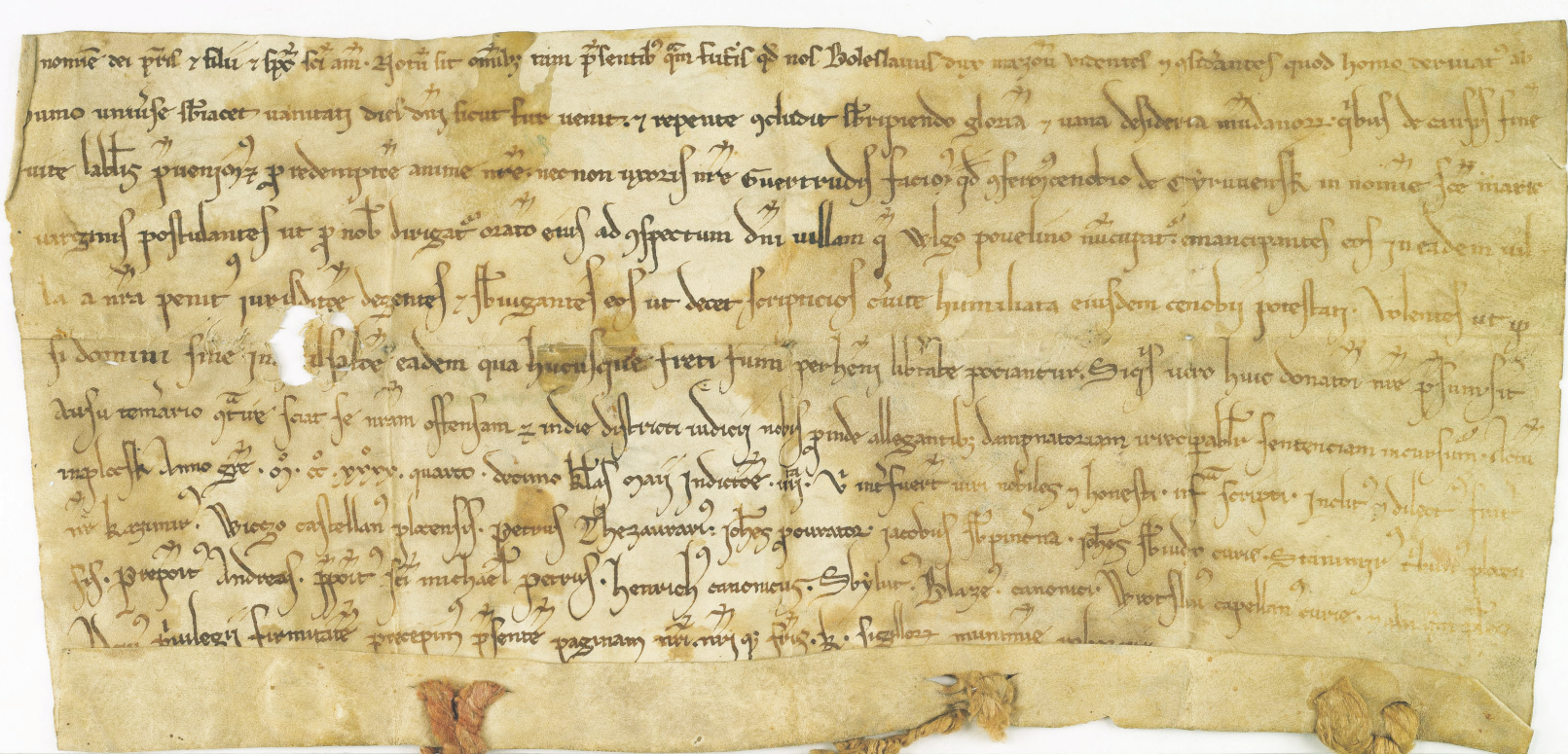
Bolesław, książę mazowiecki, nadaje klasztorowi kanoników regularnych w Czerwińsku wieś Powielin, 22 kwietnia 1244 r. (AGAD, zbiór dokumentów pergaminowych nr 6437)

fii w Zegrzu (Z Powielina, wsi rządowej alternatą z Wieliszewem).