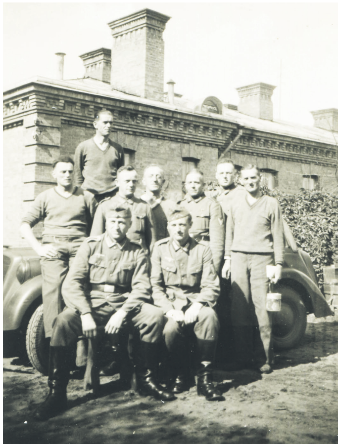
Żołnierze niemieccy w Beniaminowie, b.d.

Na innym zdjęciu pozują żołnierze łączności, którzy noszą na rękawach charakterystyczne „pioruny”. Ustawili się na tle parterowego budynku koszarowego, pochodzącego jeszcze z czasów zaboru rosyjskiego. Podobnie jak pozostałe obiekty został on wzniesiony w 1908 r. dla żołnierzy 2. Zegrzyńskiego Pułku Piechoty Fortecznej. Wtedy jeszcze Beniaminów należał do twierdzy Zegrze. Warto dodać, że carskie zespoły koszarowe, pozornie takie